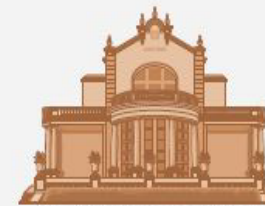
Xalet Camps Elisis